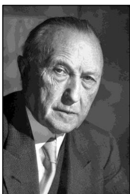
Konrad Adenauer, 1952