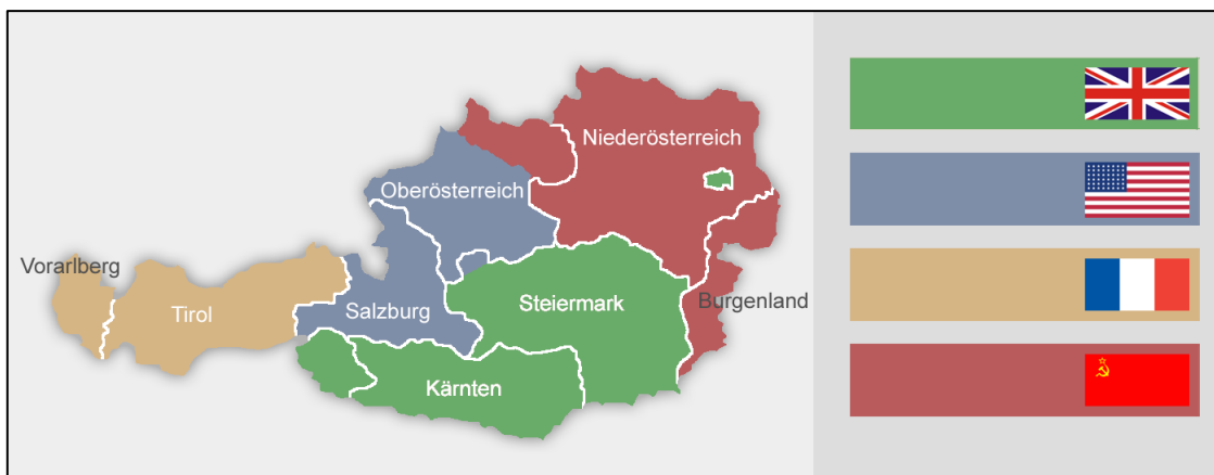
Okupační zóny v Rakousku, 1945-1955