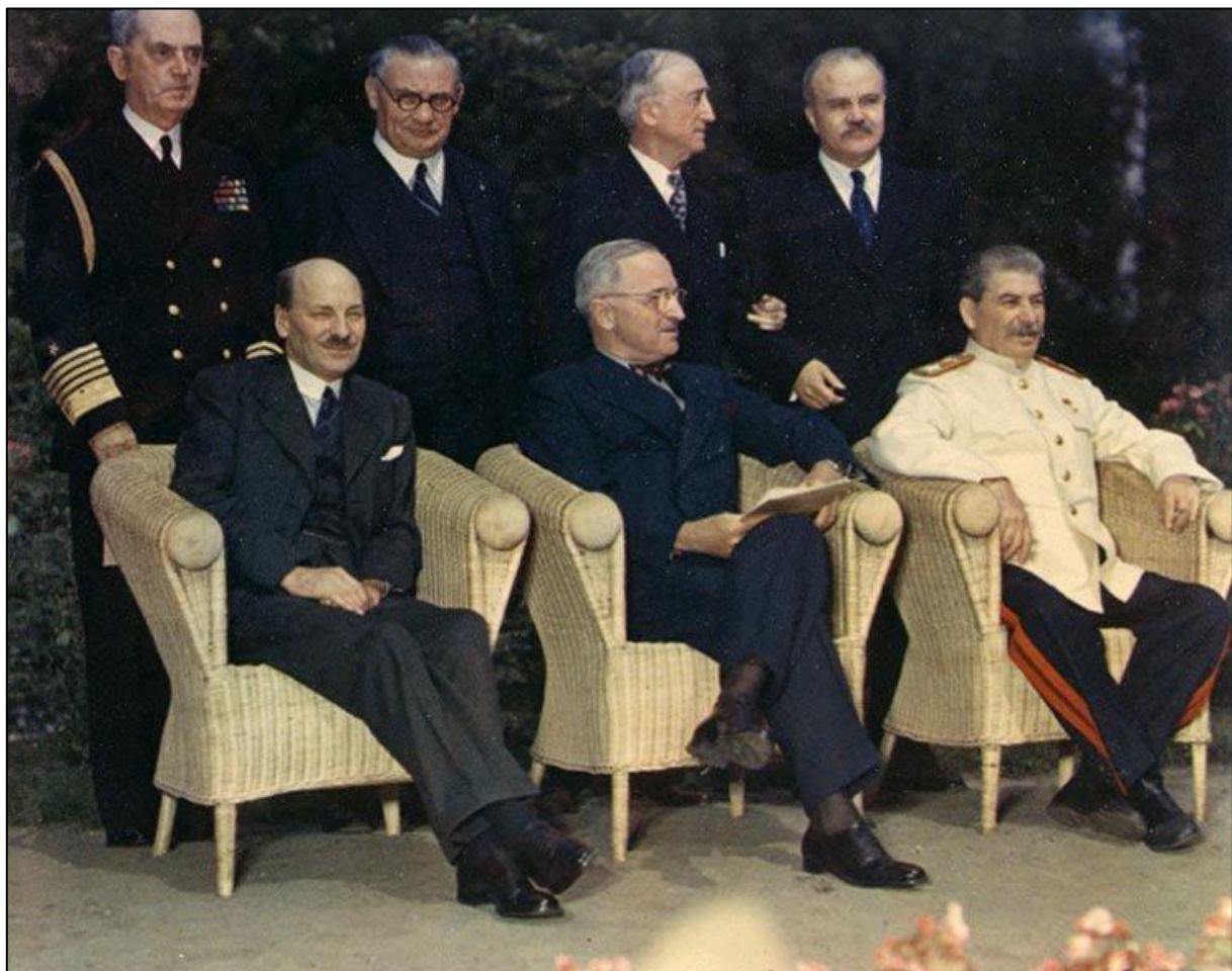
Zástupci vítězných velmocí na konferenci v německé Postupimi (zleva sedící Attlee, Truman, Stalin)